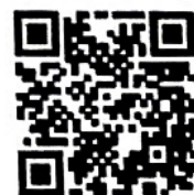
ประกาศฉบับเต็ม